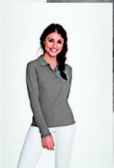
SOL'S PODIUM 11317