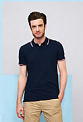
SOL'S PRESTIGE MEN 02949