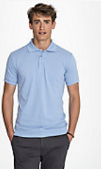
SOL'S PRIME MEN 00571