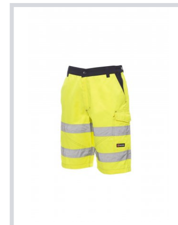
AMARILLO FLUORES CENTE/AZUL MARINO