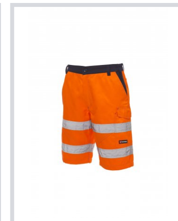
NARANJA FLUORESC ENTE/AZUL MARINO