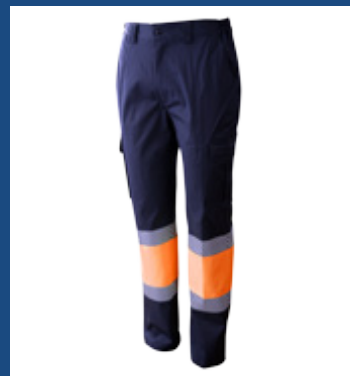
032 Marino/Naranja AV