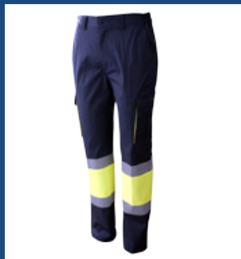
031 Marino/Amarillo AV

OEKO-TEX® CONFIDENCE IN TEXTILES STANDARD 100